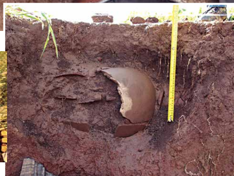
Peças raras de estátuas de cerâmica foram localizadas a 354 m de Palmas

"A eficiência cruel foi tanta, que ao final da Guerra dos Bárbaros, não havia quase índios Cariri vivos", aponta Rietveld. Mas nem tudo estava contra os índios. Missionários tentaram proteger os índios criando as "missões". Os padres Oratorianos montaram um aldeamento Sucuri na Vila de Cimbres (entre Pesqueira-PE e Monteiro-PB). Em São João do Cariri (PB), os Jesuítas criaram outra missão em 1700. Capuchinhos franceses fundaram a missão de Boqueirão (PB) em 1671. Em Fagundes, entre 1634 e 1670 os Jesuítas ergueram uma fazenda para aldeamento Cariri, onde os índios viviam em paz, seguindo as normas da igreja.