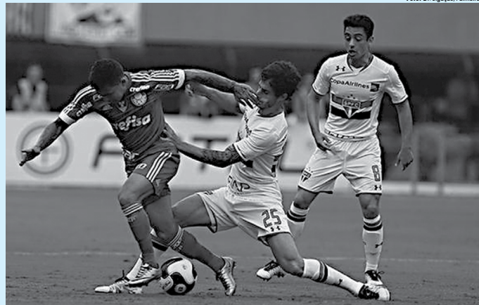
Depois de vencer o São Paulo, o Palmeiras agora enfrenta o Santos na rodada deste domingo pelo Campeonato Paulista. Artistas vêm de vitórias