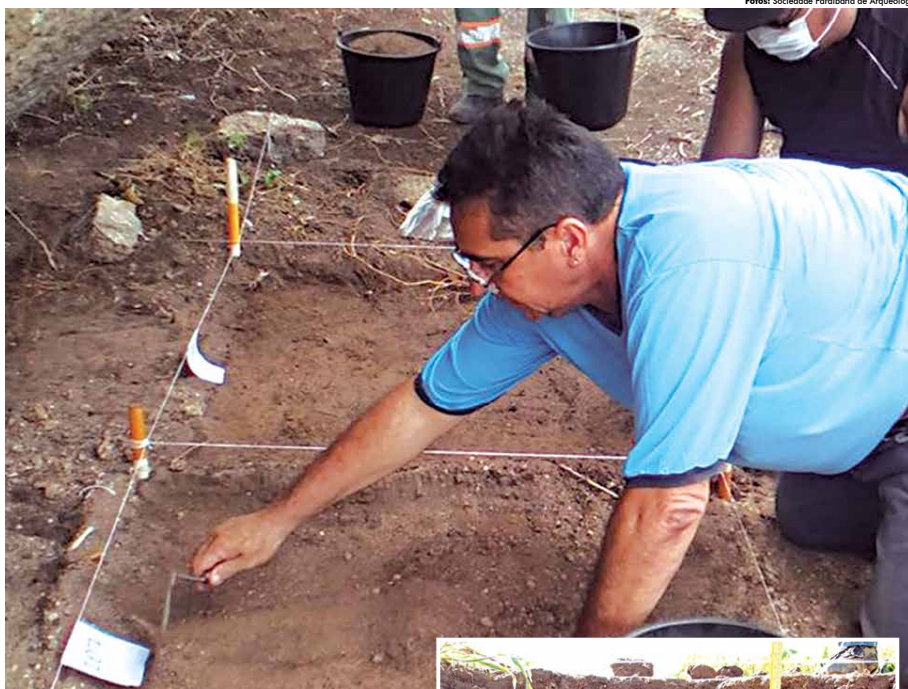
Escavações foram realizadas por membros da Sociedade Paraibana de Arqueologia

De um trabalho assim surge um pouco da história deste povo Cariri e a oportunidade de conhecer nossas raízes