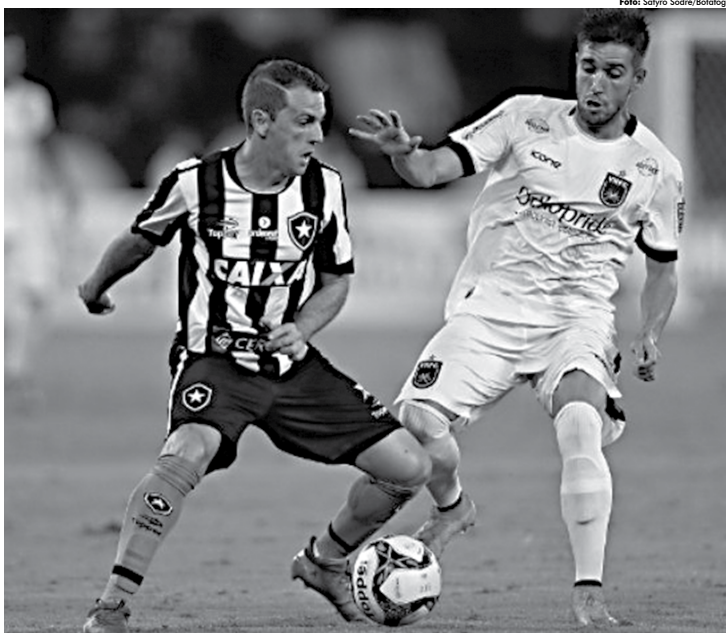
Botafogo, depois de vencer o Estudantes, tem mais chances de se coronar, agora pela Taça Rio, onde enfrenta o Vasco que vive momento de crise

"Hoje estamos em 60% da nossa forma física. Temos três ciclos. Se eu chegar no auge no primeiro, como vou chegar no terceiro? A ideia é de que (os reforços) tenham um auge até o fim do Carioca, para estar no nível competitivo e disputar em igualdade com os outros times. Depois que alcançar o auge, o trabalho é de manutenção, cuidar para que não despenque" explicou Evangelista, otimista sobre uma vitória diante do Botafogo hoje no Engenhão.